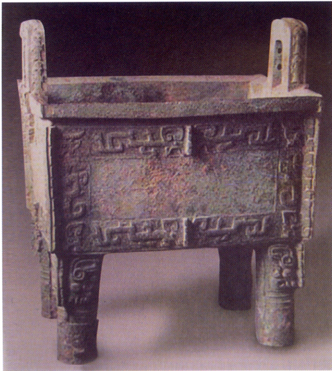
图 1-2 河南安阳出土的司母戊大方鼎

力求自然美与人工美的和谐统一。在园林构筑过程中，如何处理“人工”与“天然”的关系？明代计成在其所著《园冶·园说》中提出了“虽由人作，宛自天开”的设计理念。亦即，人造景观（如屋宇、花木、山石等）应与自然景观和谐相生、相映成趣、浑然一体，将人工巧藏于天工，将人工美融于自然美。其三，注重园林景观建筑与大自然的有机联系。正如当代著名学者宗白华先生所指出的，“古希腊人对于庙宇四围的自然风景似乎还没有发现。他们多半把建筑本身孤立起来欣赏。古代中国人就不同。他们总要通过建筑物，通过门窗，接触外面的大自然”。 ① “窗子在园林建筑艺术中起着很重要的作用，有了窗子，内外就发生交流。窗外的竹子或青山，经过窗子的框框望去，就是一幅画。” ② 这种把内外景物有机地联系在一起，在园林景观设计时进行通盘考虑、加以整体把握的做法，是中国古典园林设计的一个鲜明特点。其四，以人为中心，构建一种令人心旷神怡的“天人合一”的艺术空间。中国传统园林景观设计强调以人为主体的，按照人的需要来设置一切景物及亭台楼阁。按照中国传统哲学和园林美学的观点——园林中的一切，不管是山、是水、是林木、